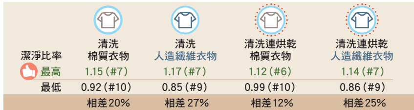
表二：潔淨比率 ✨ ✨